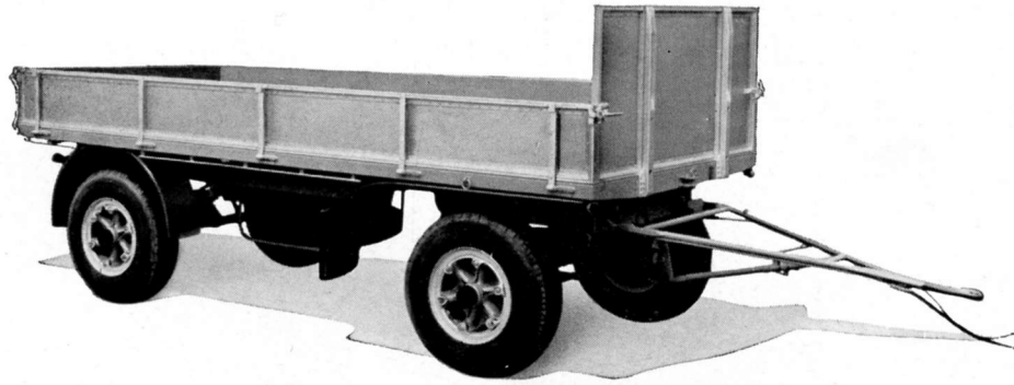
Zweiachsanhänger 7-8 To