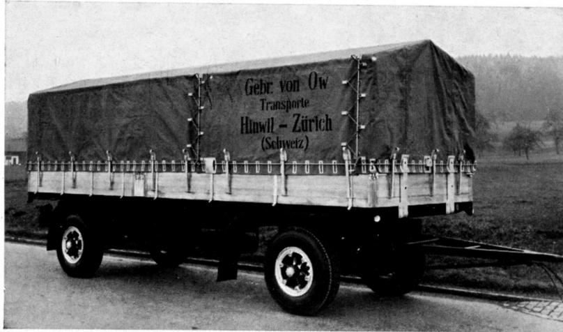
Zweiachsanhänger 15 To