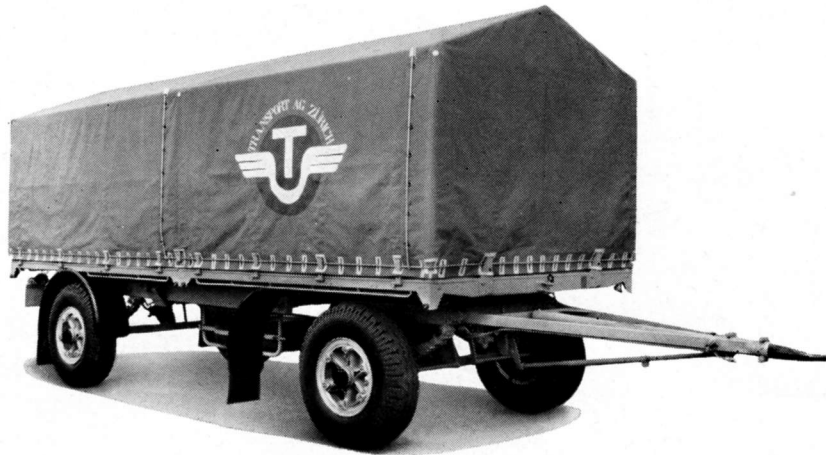
Zweiachsanhänger 12-14 To